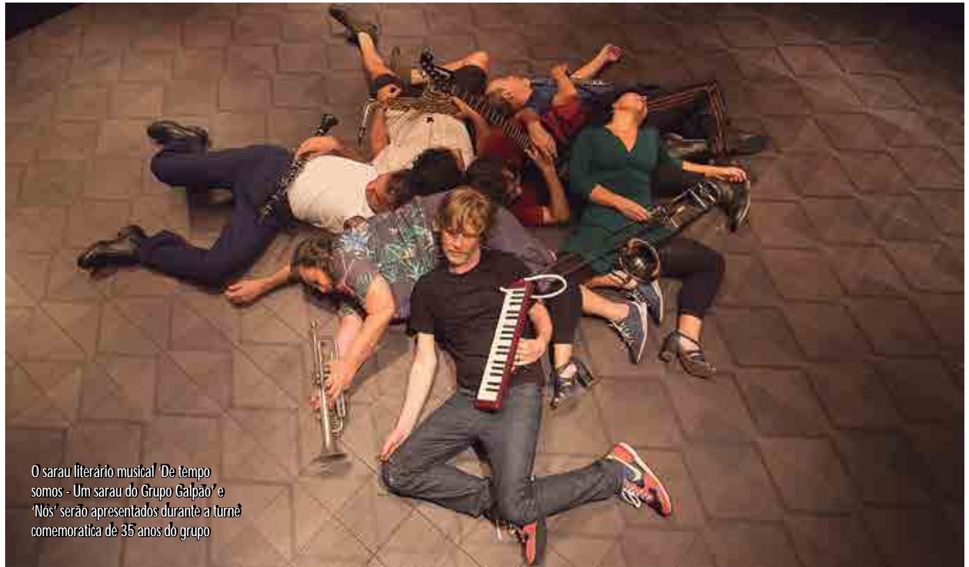
O sarau literário musical 'De tempo somos - Um sarau do Grupo Galpão' e 'Nós' serão apresentados durante a turnê comemorativa de 35 anos do grupo

O sarau intitulado De Tempo Somos - Um Sarau do Grupo Galpão, cujo novo disco - o quinto - homônimo da companhia mineira produzido por Chico Neves que traz a trilha sonora desse espetáculo também será apresentado ao público em João Pessoa, estreou em 2014 e traduz um antigo projeto do grupo de celebrar o encontro da música com o teatro, parceria que se tornou marca do Galpão ao longo da trajetória que até agora percorreu. O espetáculo, com 70 minutos de duração, reúne textos sobre a passagem do tempo e o processo de criação artística, além de 25 canções do repertório musical do grupo - de montagens antigas até obras mais recentes - incluindo músicas de workshops internos que chegam à população pela primeira vez.