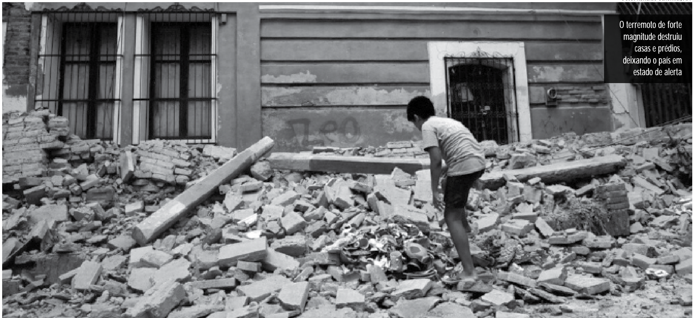
O terremoto de forte magnitude destruiu casas e prédios, deixando o país em estado de alerta