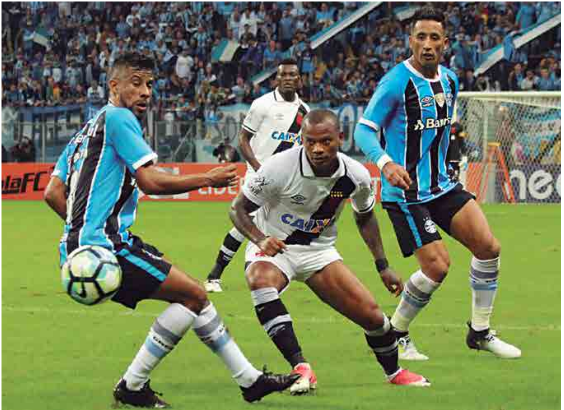
No primeiro turno, as duas equipes jogaram na Arena do Grêmio com vitória gaúcha por 2 a 0. Hoje, o time vascaíno sem a presença de seu torcedor pode se vingar da derrota em casa