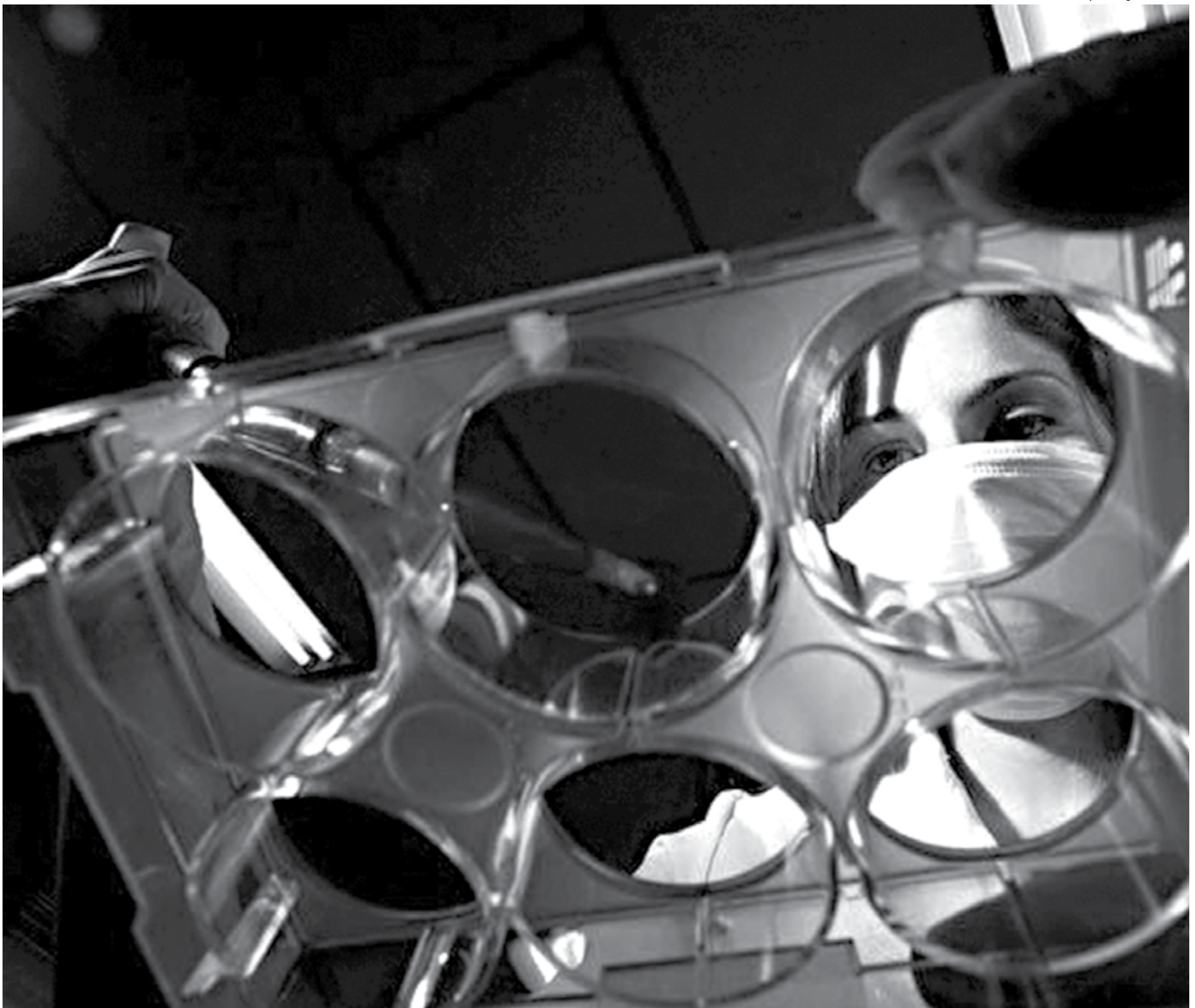
Pesquisa e desenvolvimento realizados em instituições de ensino serão direcionados a atender ao mercado, isto é, os estudos vão atender às demandas do setor produtivo

“Durante muito tempo, a gente caminhou de forma dissociada entre as áreas de inovação, educação e, sobretudo, produção. Havia um verdadeiro preconceito em relação à atividade produtiva e ao setor industrial. Nesse aspecto, os institutos federais contribuíram de forma decisiva para aproximar a área educacional de formação técnica e profissional do setor produtivo”, afirmou o ministro da educação, Mendonça Filho.