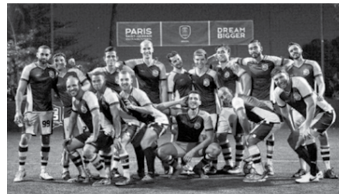
A equipes do BeesCats Soccer Boys irá disputar mais uma competição