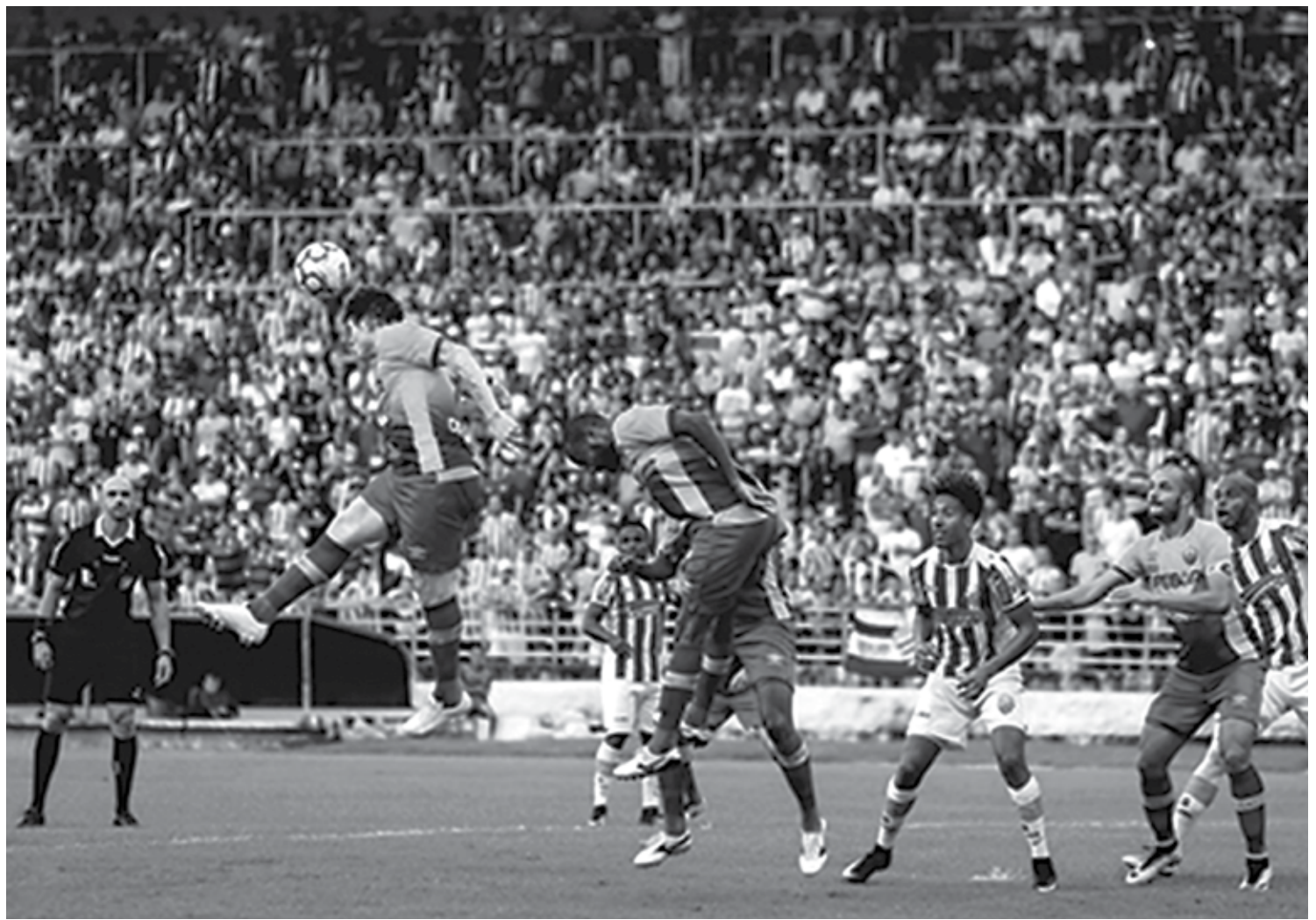
O Cuiabá tem poucas chances de classificação, principalmente pelo fato de ter poucas vitórias, apenas quatro. Recebem em casa o vice-líder CSA hoje

é interessante, uma vez que o Carcará joga pela classificação e também contra o rebaixamento. O clube pernambucano ocupa o 7º lugar com 21 pontos e seis vitórias. Só a vitória interessa aos nordestinos. Se vencer o Remo, o Salgueiro estará livre do rebaixamento e, para se classificar, precisará de mais dois cenários: derrota do Fortaleza, tropeço do Confiança ou tropeço do Cuiabá.