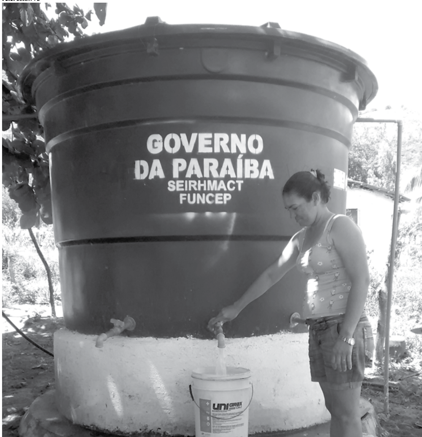
Em Itatuba, por exemplo, foram instaladas 360 cisternas que representam um investimento superior a R$1 milhão, uma delas na comunidade rural de Melancia

as famílias. “É com a venda dos frangos que a gente consegue obter uma renda. Nós vendemos cada frango, em média, por R$12,00. Aqui mesmo nós criamos e abate o frango. Só temos a agradecer esse olhar que o governo está tendo com a gente”, destacou.